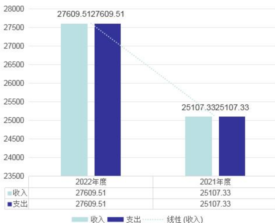
收入支出决算总体情况

本单位 2022 年度收、支总计（含结转和结余）27609.51 万元。与 2021 年度决算相比，收支各增加 2502.18 万元，增长 10.0%，主要原因是项目资金增加-2023 年老旧小区改造项目。