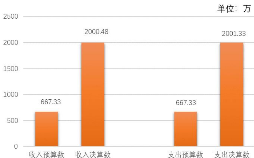
财政拨款收支预决算对比情况

3. 国有资本经营预算财政拨款本年收入与年初预算均为 0 万元，与预算持平，无增减变化；本年支出与年初预算均为 0 万元，与预算持平，无增减变化。